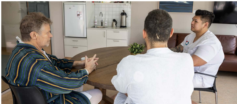
Mynd 2. Sjúklingar og starfsmaður í setustofu deildar

Viss hætta er á óráði eftir hjartaaðgerð. Orsakir óráðs eru margþættar en einkennin geta verið truflun á meðvitund, vitrænni getu og skynjun. Einkenni geta birst sem óróleiki, eirðarleysi, aukin syfja, óáttun eða vanvirkni. Mikilvægt er að aðstandendur láti vita ef ber á þessum breytingum hjá sjúklingi svo hægt sé að bregðast við sem fyrst.