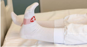
Kreppa og rétta ökkla

Gera þarf fótæfingar reglulega til að minnka hættu á myndun blóðtappa og fylgja endurhæfingaráætlun til að ná sem bestum bata. Forðast þarf að krossleggja fætur þar sem það getur truflað blóðrás í fótum.