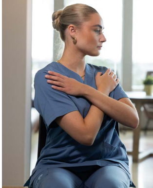
Snúðu þér og horfðu aftur í báðar áttir.