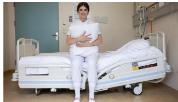
Stattu upp án þess að leggja álag á hendur