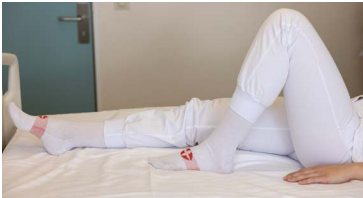
Draga hæla til skiptis í átt að rassi