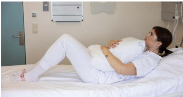
Haltu kodka þétt að bringu og dragðu hæla að rassi

Virk þátttaka í endurhæfingu á deild er lykilþáttur fyrir góðum bata og hluti þessarar virkni er til dæmis að borða í setustofu deildar og sitja í stól milli göngutúra.