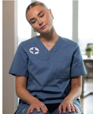
Hallaðu höfði í átt að öxl, haltu teygju í 10 sekúndur.