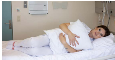
Veltu þér yfir á hliðina