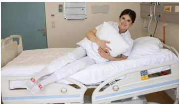
Settu fætur út fyrir rúmstokk og þrýstu upphandlegg niður í dýnuna til að setjast upp