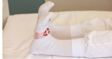
Spenna hné niður í dýnu og slaka