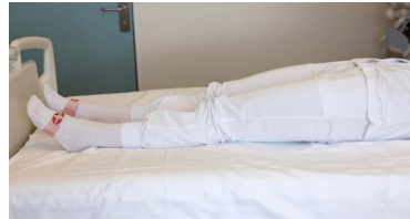
Spenna rasskinnar og slaka